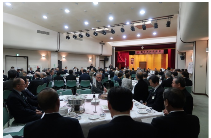
賀詞交歓会 会場風景