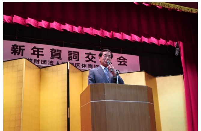
下村博文 衆議院議員