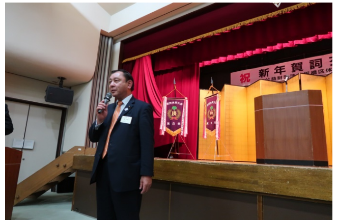
橘 正剛 都議会議員